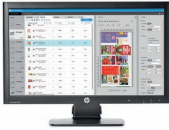
Software HP SmartStream

Diseñado especialmente para departamentos reprográficos de grandes empresas y tiendas de reproducción que buscan una administración correcta y fácil de PDF, el software HP SmartStream es una solución de software profesional que reduce el tiempo de preparación de trabajos hasta un 50 % en trabajos complejos 4 y evita las reimpressiones con vistas previas de impresión precisas.