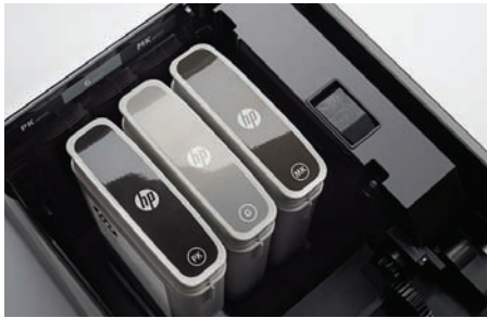
Conjunto de tres tintas negras HP

Mejore la productividad con el multifuncional más rápido del mercado 1 para todas sus necesidades en blanco y negro y color. Disfrute del funcionamiento sin pausas a costos que compiten con multifuncionales LED blanco y negro. 2 Este multifuncional ha sido creado para demandas de TI exigentes y máxima seguridad.